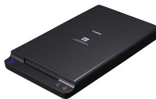
Glace d'exposition Flatbed A4 102

Via une connexion USB, ces scanners à plat s'intègrent parfaitement au DR-M260 pour bénéficier des mêmes fonctions d'optimisation des images, quel que soit le scanner utilisé pour la numérisation.